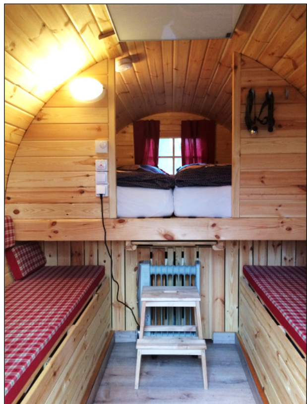
Übernachtungsmöglichkeit im Wildpark