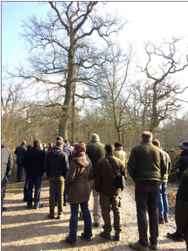
Wildparkbesichtigung bei bestem Wetter

Bei Sonnenschein und nach ausgezeichneter Verpflegung konnte der rund 90 ha große Wildpark unter fachkundiger Leitung von Thomas Hennig besichtigt werden.