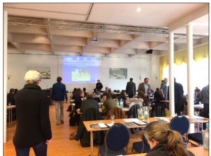
Rege Diskussion im Tagungssaal

Des Weiteren wurde das Wolfsmanagement sowie das Wolfskonzept in Niedersachsen vorgestellt.